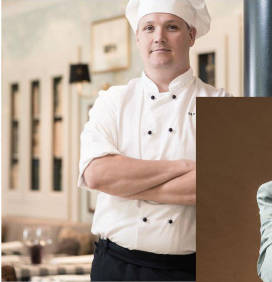
Kokemuksen syvällä rintaäänellä