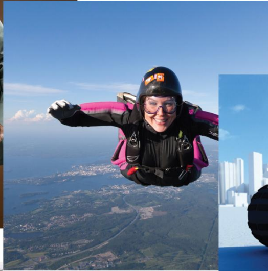
3 minuuttia aiemmin