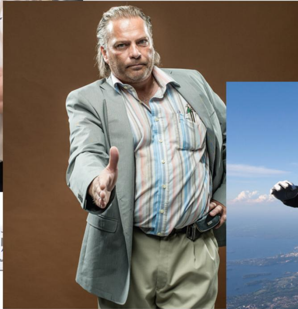
Minuun voit tiedätkö luottaa